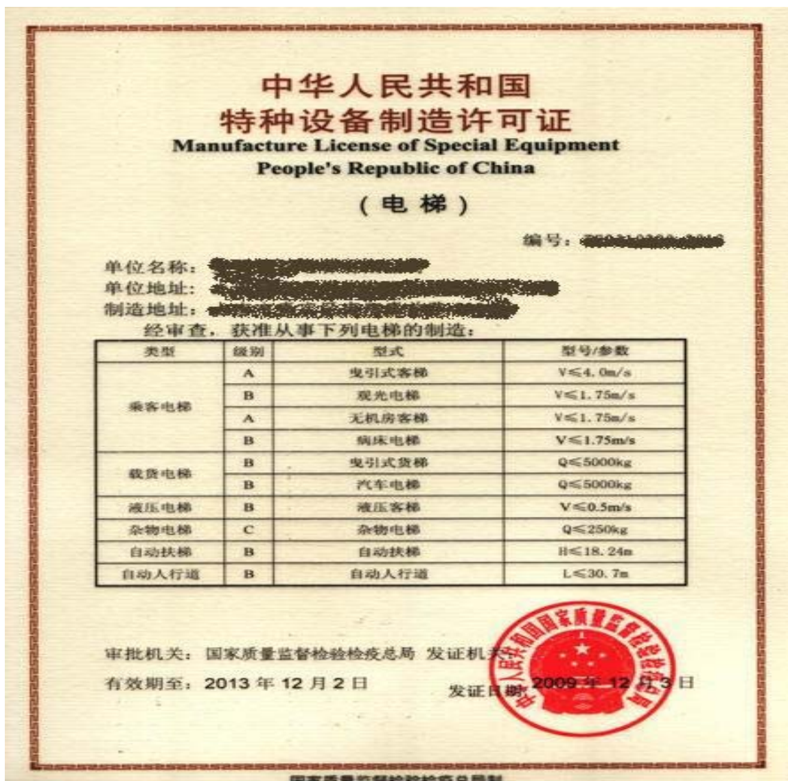
图1、“制造许可证明文件”示例

第(1)项“制造许可证明文件”，即《机电类特种设备制造许可规则（试行）》（国质检锅【2003】174号）中描述的《特种设备制造许可证》，其覆盖范围原则见《机电类特种设备制造许可规则（试行）》附件1。